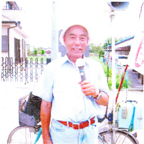
日々の活動の日記に掲載されている写真