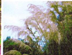
秋留台公園のすすき