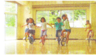
学童保育所で一輪車で遊ぶ子ども達

公立阿伎留医療センター 院長との懇談会も行い、市民の健康と生命を守る医療機関になるよう話し合いをしました。