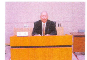
阿伎留病院組合議長

10ヶ月前、私が病院議会の議長に就任しました。全国で公立病院が倒産しています。さっそく病院経営の改善計画を議員の勉強会や病院内の視察などや荒川院長や看護部長、スタッフらと懇談会を行い、日の出町、松原村の病院議員と同じ病院議員として、心を一つにして公立