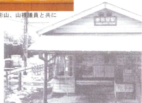
懐かしい東秋留駅休憩所で挨拶