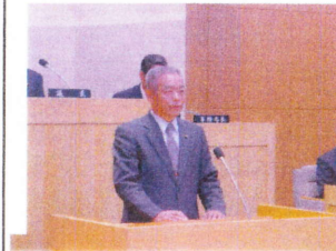
環境建設委員長報告