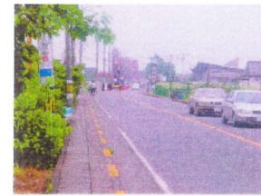
五日市街道の歩道の改修

2005年の改選後、市議会環境建設委員長に就任。三年間の農業委員としての経験を生かし、環境基本計画及び農業振興計画「やったんべー」策定に議会側として努力。農業委員会との懇談会をはじめ、商業振興にあたっては、秋川駅北口会（商店会）と市議会の「知恵だし会議」など積極的にすすめました。