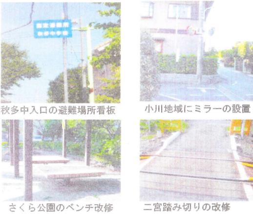
秋多中入口の避難場所看板