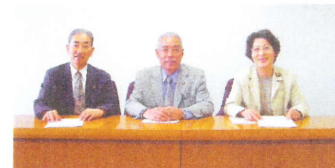
影山、山根議員と共に