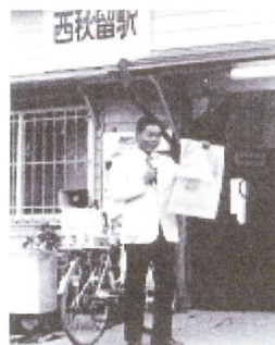
32年前、西秋留駅で挨拶