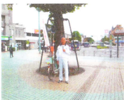
今も自転車で街頭での挨拶