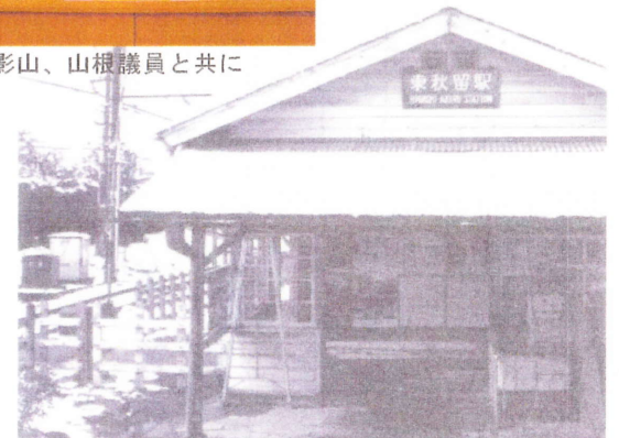
懐かしい東秋留駅休憩所の屋根の下で通勤者に挨拶