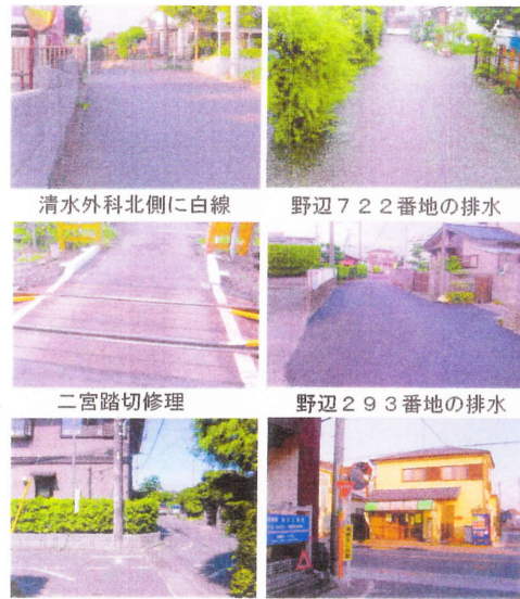
清水外科北側に白線

環境改善では、五日市街道の歩道整備や野辺地域の雨水排水問題、菅生地区の諸要求に答え、下水道工事やカーブミラーの増設などを取り組みました。