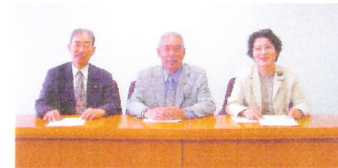
影山、山根議員と共に