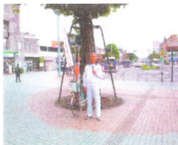
今も自転車で街頭での挨拶