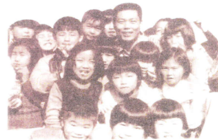
28年前、子ども広場でのスナップ

健康に恵まれ、今日まで市議会議員として一度も議会を休むことなく、遅刻も早退もせず、議会外の活動も元気に頑張ることが出来ました。市議会では初めてのことだと自負しています。体の許す限りこれからも頑張る決意です。7年前、IT情報化社会の到来となり、先取りしてホームページを立ち上げ、議会報告と個人のブログを掲載し七万五千を数えるアクセスがされ、市民の皆さんと情報や意見の交換も続けています。これからもよろしくご支援ください。