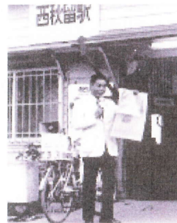
32年前、西秋留駅で挨拶