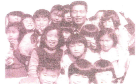
28年前、子ども広場でのスナップ

健康に恵まれ、今日まで市議会議員として一度も本議会を休むことなく、遅刻も早退もせず、議会外の活動も元気に頑張ることが出来ました。歴代の市議会では初めてのことでと自負しています。体の許す限りこれからも頑張る決意です。 これからもよろしくご支援ください。