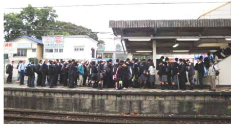
バス停・市民野球場前 ↓ (旧西草花)

あきる野市民の唯一の大量移動手段であるJR五日市線。ダイヤの改善とともに秋川駅、東秋留駅のホームの屋根を延長して欲しいという強い要望があります。各駅ホームの屋根延長を市としてJR八王子支社に強く申し入れすべきと質問しました。