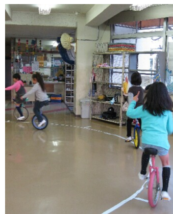
元気に遊ぶ学童クラブのこどもたち

学童クラブは少しずつ定員を増やしていますが、増え続ける希望者と、安全の確保、時間延長などの要求の根本的な解決にはなっておらず、特例利用の110人を差し引いても47人が待機児になる見込みです。保育園も定員を増やしてはいるものの、もっとも求められている0歳～2歳児保育が不足していることには変わりなく、働きに出ることを望んでいる若い世帯の希望には応えられていません。小中学校の耐震化は、23年度でようやく完了することになりましたが、今回の震災などを考えると、これはそもそも当然行われているべきだったものであり、一刻もはやい工事の完了が望まれています。