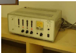
これがアンプです。

ふれあいホールに設置されている磁気ループシステムは、講演会などマイクの音を拾うのではなく、音楽や映画などの音を大きくして聞かせるものです。なつかしの映画やコンサート、ダンスも楽しめます。