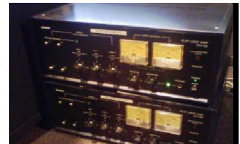
座席のあるなして2台のアンプを使い分けます。