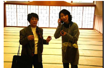
補聴器で試聴中。「なるほど、よく聞こえます」

ふれあいホールに設置されている磁気ループシステムは、講演会などマイクの音を拾うのではなく、音楽や映画などの音を大きくして聞かせるものです。なつかしの映画やコンサート、ダンスも楽しめます。