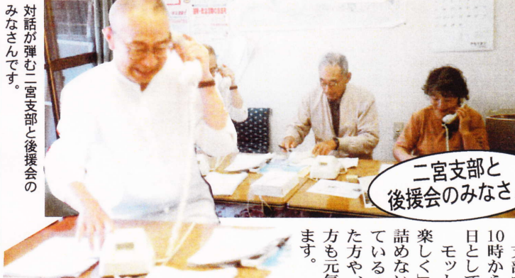
対話が弾む二宮支部と後援会のみなさんです。