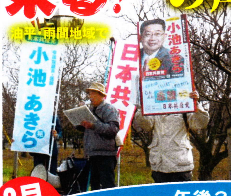
油平・雨間地域で