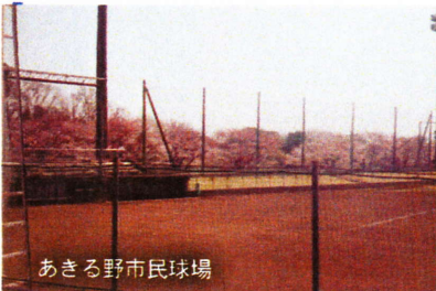
あきる野市民球場

あきる野市の大字では面積が小さい地域で、ほぼ切欠と同じ程度と思います。原小宮について「新編武蔵風土記稿」では次のように書かれています。(木崎詳略) 「郡の中心にあり、郷庄の名はない。日本橋より約五〇キロ、村の四境は東が平沢村、西は瀬戸岡村に接している。北は上草花村であり、東西が約三三〇米・南北が二二〇米である。土性は野土で、水田が多く陸田が少ない。村内は平地で戸数二十五軒が散在している。検地は一六二〇年(寛永一六)に田村茂兵衛が行った。以後、田中主計の先祖が譲り受け、その子孫が知行している。村内に神社仏寺はない」 原小宮の地名由来について「角川・日本地名大辞典」では、平井川の対岸の草花に鎮座する小宮大明神の前方の地が平坦であり、その事が由来していると書いています。原が付いた地名は全国に多くあり、原町田・原宿・原田などです。一八八五年(明一八)の「地名索引」では六十六ヶ所とされていますが、原町田を例にとってみると、町田という本村があつて、少し離れた所にある集落があり、その場所を原町田と呼ぶようになったと云われています。 現在、大字草花の中に小宮という小字があり、小宮神社が鎮座しています。小宮集落から平井川を越えた原のある所、即ち原小宮と呼ぶようになったと考えられます。(続く) 草花・木崎秀治