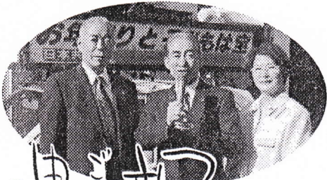
日本共産党あきる野市議会議員団