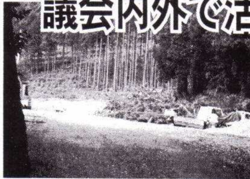
▲現在の五日市青年の家跡地の様子(05年10月3日撮影)